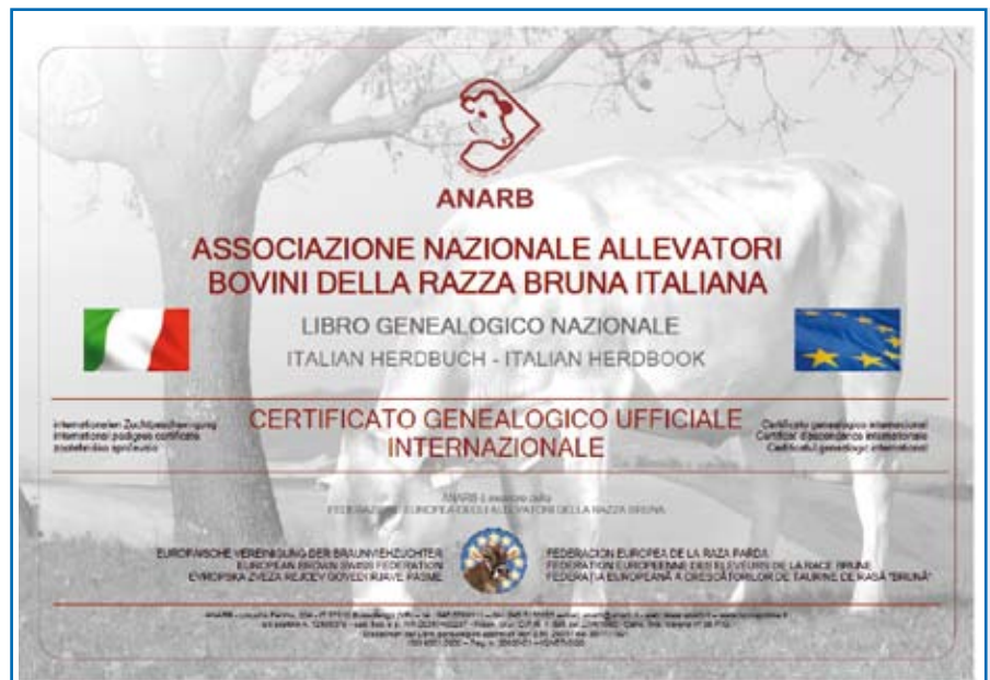
Il retro di un certificato genealogico internazionale.

Following the presentation of BRUNAONLINE, the new Internet portal grouping all the ANARB services for the breeders, this is the first article about its contents and new services. It deals with the new pedigrees, which have more technical infor-